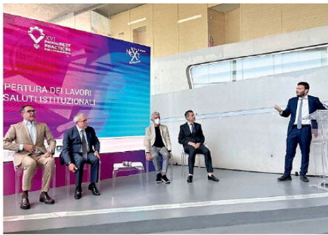
La presentazione di "Best Practices per l'Innovazione"

E ieri mattina c'è stato il taglio del nastro, alla presenza del presidente dei Confindustria