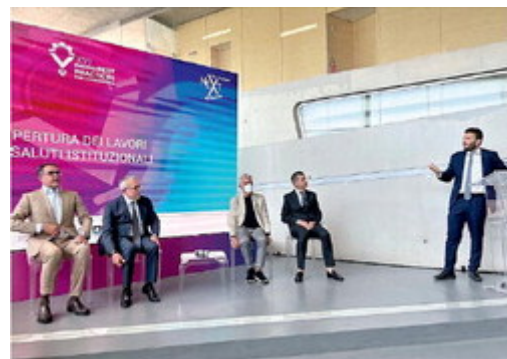
La presentazione di "Best Practices per l'Innovazione"